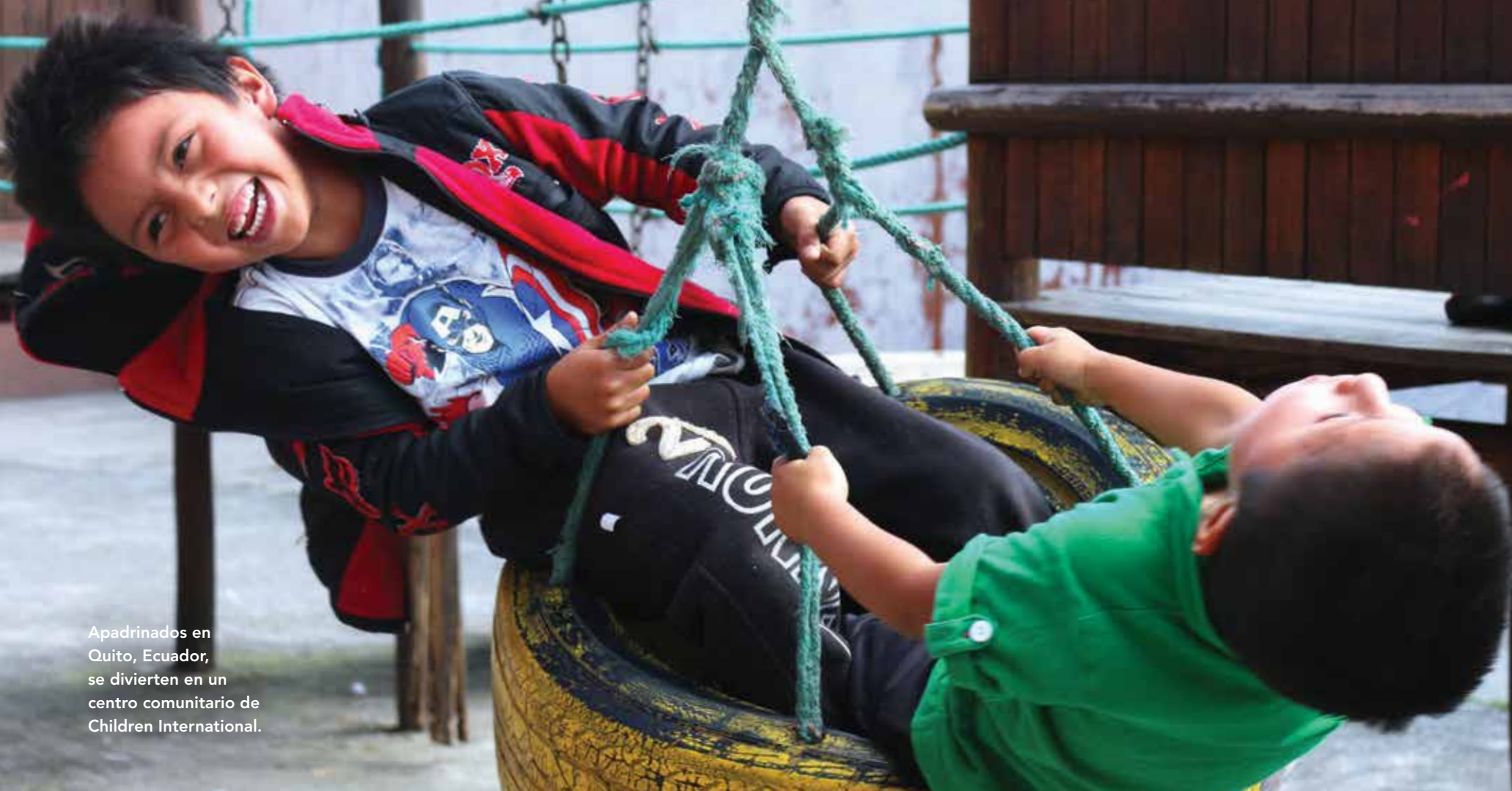
Apadrinados en Quito, Ecuador, se divierten en un centro comunitario de Children International.