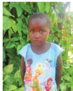
5 años de edad