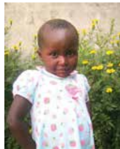
4 años de edad