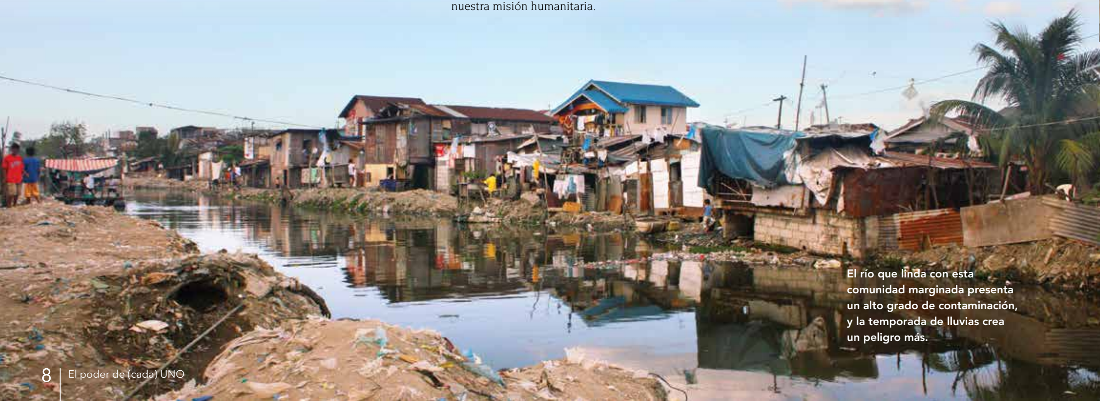
El río que linda con esta comunidad marginada presenta un alto grado de contaminación, y la temporada de lluvias crea un peligro más.