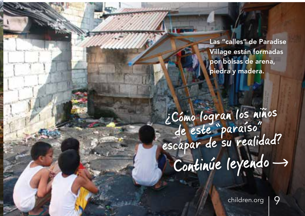
Las "calles" de Paradise Village están formadas por bolsas de arena, piedra y madera.

¿Cómo logran los niños de este "paraíso" escapar de su realidad? Continúe leyendo →